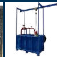
Pórtico levante 2 ton