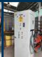
Banco de pruebas ventiladores